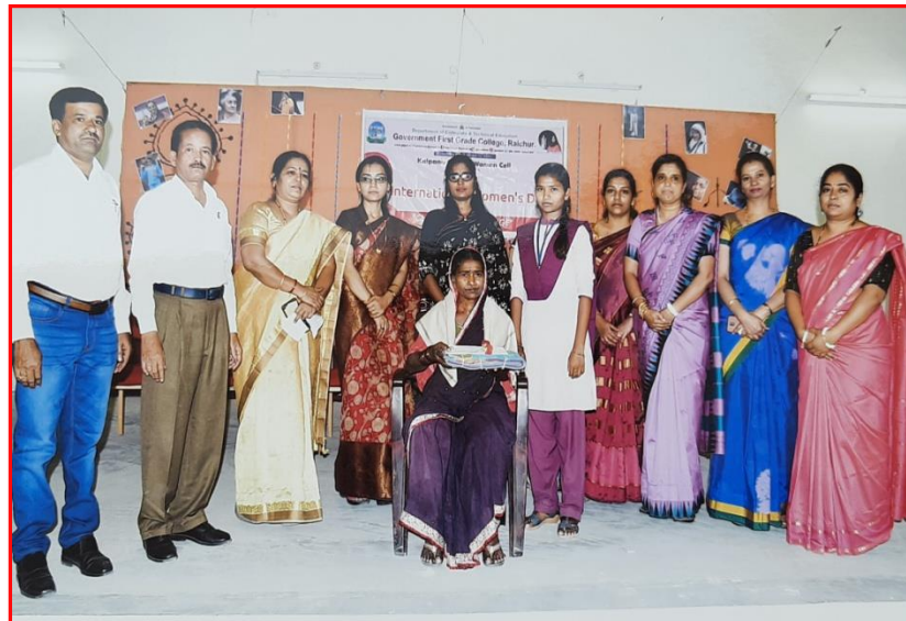
FELICITATION TO ASHA WORKER AND PARENTS OF POOR STUDENTS WITH FINANCIAL ASSISTANCE BY IDBI